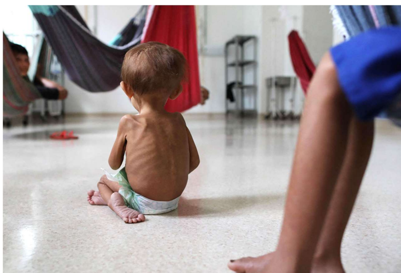
Figura 6 – imagem de criança desnutrida retirada do site Sumaúma.

Além de contaminar rios, o garimpo ilegal provocou doenças nas comunidades indígenas e prejudicou as áreas de caça e lavoura. Sob o governo Bolsonaro, o estímulo ao garimpo levou 570 crianças Yanomami à morte por causas evitáveis. 42