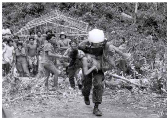
Figura 1 - Piloto de helicóptero da Força Aérea Brasileira socorre Yanomami doente da maloca Hemosh.