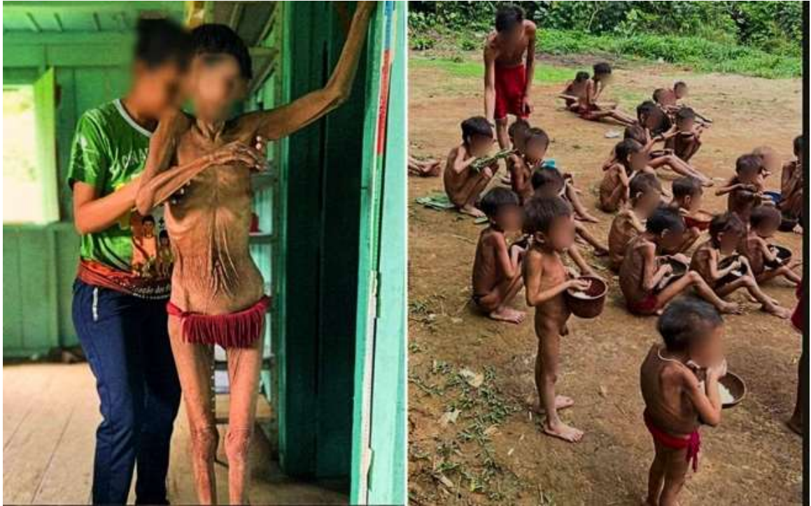
Figura 5 - Rede Brasil Atual (2023)

As fotos acima correram o mundo no começo do ano de 2023 e trouxeram à coletividade memórias estarrecedoras há muito ilustradas em tons graves nos livros de História quando tratam dos desnutridos dos campos de concentração da segunda guerra mundial. Ao mesmo tempo, deixam claro o quanto a violação ao DHAA e aos seus pilares de segurança e soberania alimentar tratam-se apenas de ilações virtuais, destituídas de materialidade, quando da exposição pública da condição sanitária e alimentar da população indígena Yanomami, submetida ao julgo da fome e do desarvoramento humanitário.