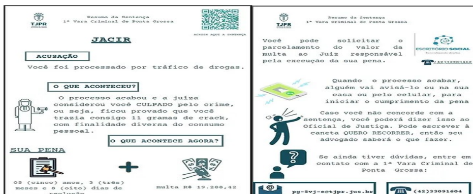
Figura 3 - RESUMO DE SENTENÇA