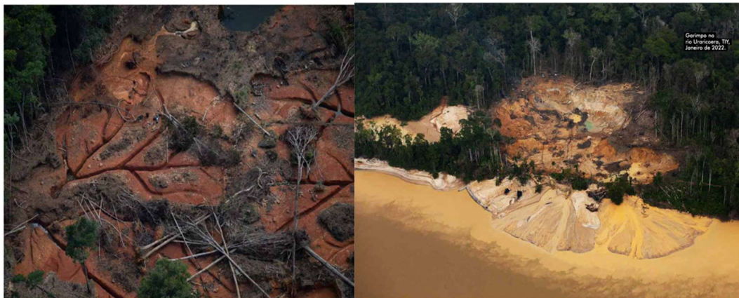
Figura 3 - Garimpo no Rio Novo e no Rio Uraricoera em Terra Indígena Yanomami (ISA, 2022)

As trágicas imagens a seguir mostram com clareza a dimensão da invasão garimpeira no território Yanomami, afetando o meio em que vivem e, por consequência, contaminando suas principais fontes de acesso à alimentação adequada, inalienável direito humano 18 .