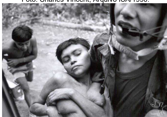
Figura 2- Piloto de helicóptero da Força Aérea Brasileira na remoção de mulher Yanomami doente da maloca Hemosh para o posto médico de Surucucus.

Apesar das tragédias envolvendo os povos originários não serem inéditas, jamais tais fatos haviam ocorrido com o incentivo ideológico, moral e material do Estado Brasileiro, que na figura de seu Presidente da República, loteou a FUNAI com defensores do garimpo ilegal, interrompeu a demarcação de terras indígenas e institucionalizou a certificação de propriedades privadas que estivessem dentro de terras indígenas não homologadas. 11